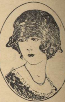
Moderna Sammetshattar fr. kr. 14.25.

för än Ni har sett vårt kolossala urval i de se- naste nyheter av