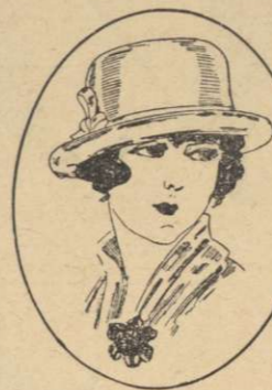
Moderna Filthattar fr. kr. 6.85.